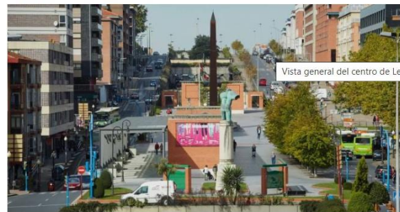
Vista general del centro de Leioa.

MARTA HERNÁNDEZ / LEIOA | 04.11.2021 | 00:57