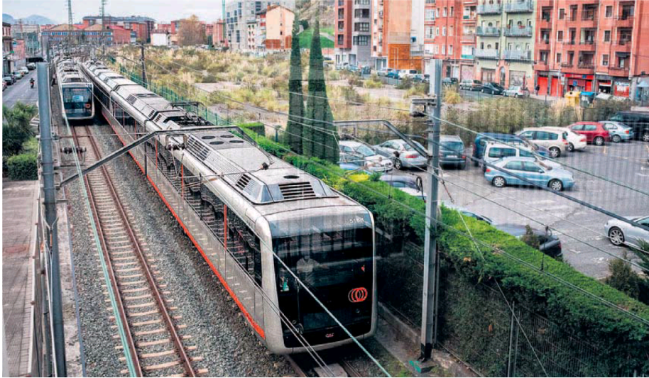
El soterramiento del trazado metropolitano es una de las reivindicaciones históricas del barrio de Lamiako.