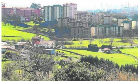
La futura normativa regulará los edificios y suelos del municipio, que clasificará en urbano, urbanizable y no edificable.

El proceso, que incluye la participación vecinal, puede prolongarse hasta cinco años al incluir ocho fases